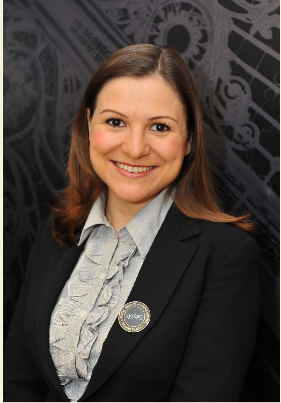
Personnel des Galeries Lafayette, Paris